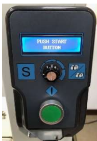
Einfache Bedienung mit Klartextanzeige