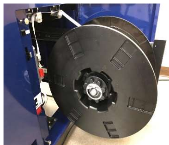
Innen liegende Bandspule ausfahrbar